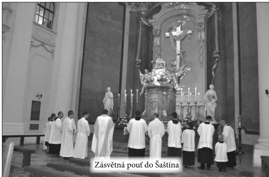
Zásvětná pouť do Šaštína