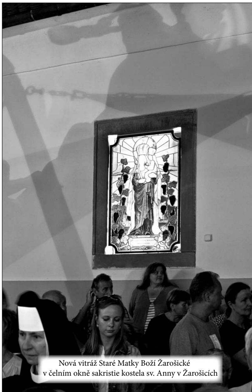
Nová vitráž Staré Matky Boží Žarošické v čelním okně sakristie kostela sv. Anny v Žarošicích