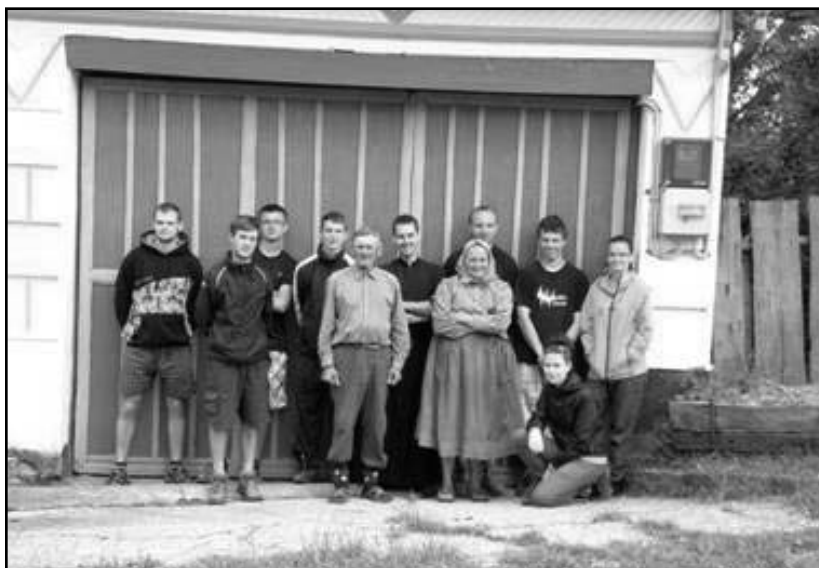
Společná fotografie s manželi Nejedlými.